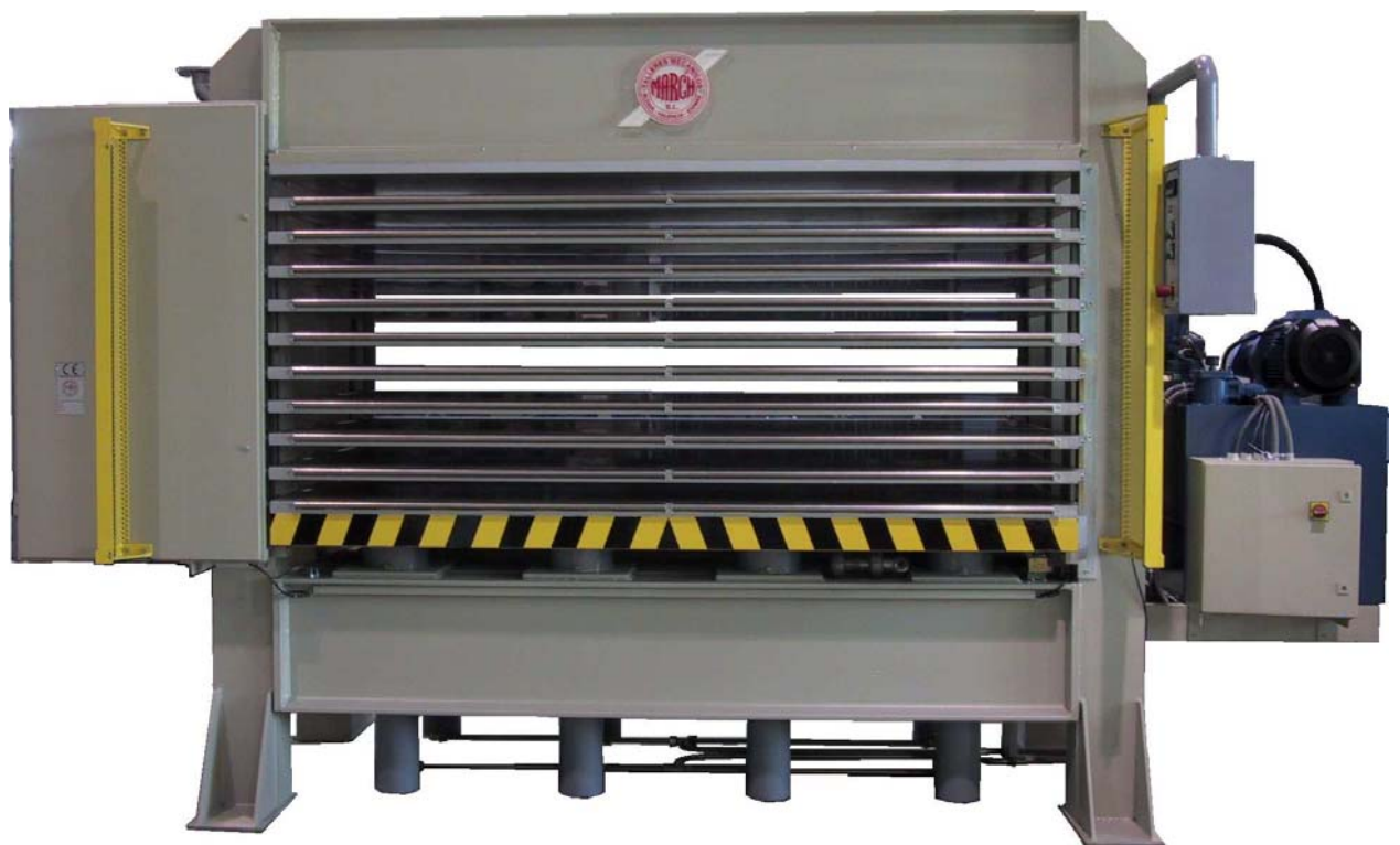
MODELO PHH 2714-10

El número de huecos de trabajo se ajusta según las necesidades de nuestros clientes.